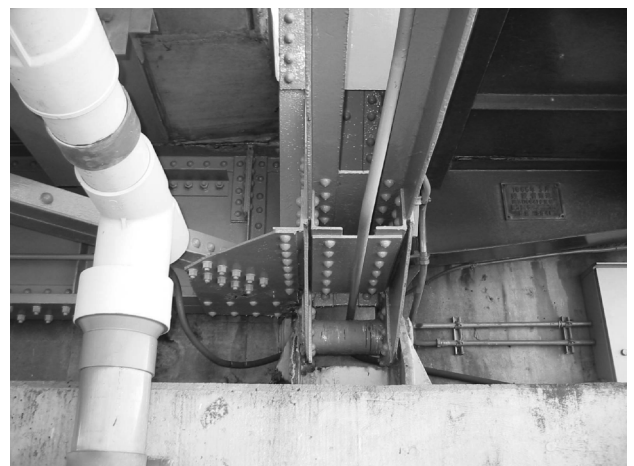
吉野川橋ディテール