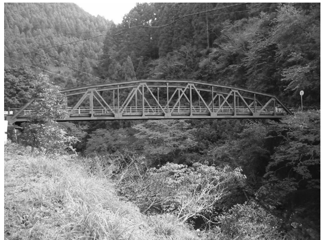
サンノウ橋（那賀町）

沿革 サンノウ橋は、主要地方道日和佐上那賀線上の、深森公民館（旧深森小学校）のすぐ北側を流れる古屋谷川（那賀川支流）に架かる橋である。この橋の隣りには、旧の橋台跡があり、形状から吊橋であったことが伺える。橋の銘板から昭和29年3月に新橋が供用された後、吊橋は撤去されたようである。