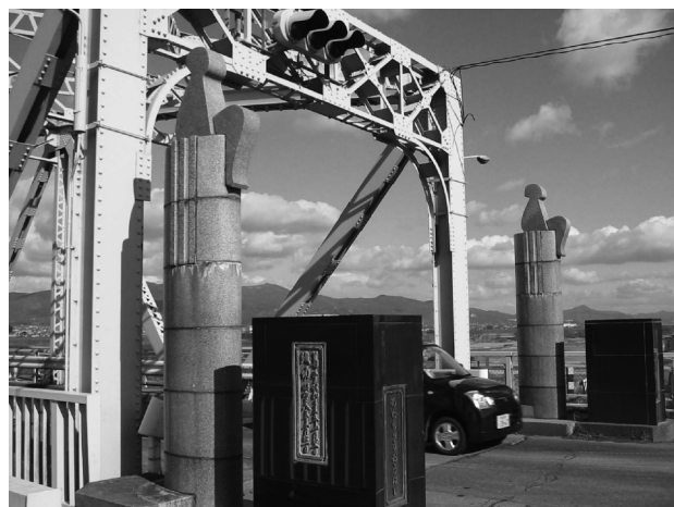
イサム・ノグチの彫刻