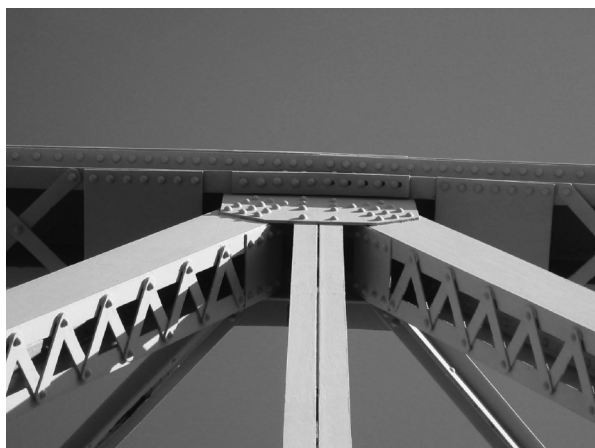
吉野川橋トラスディテール