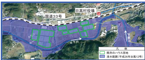
平成26年8月台風12号による農作物等被害状況