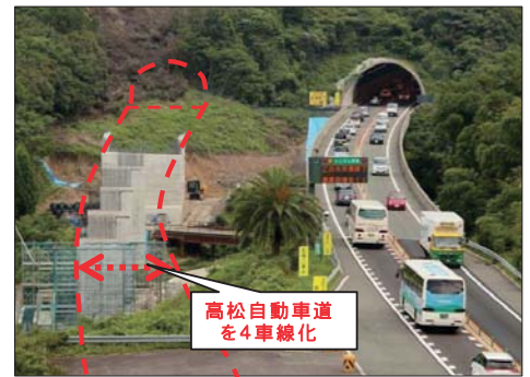
高松自動車道 を4車線化